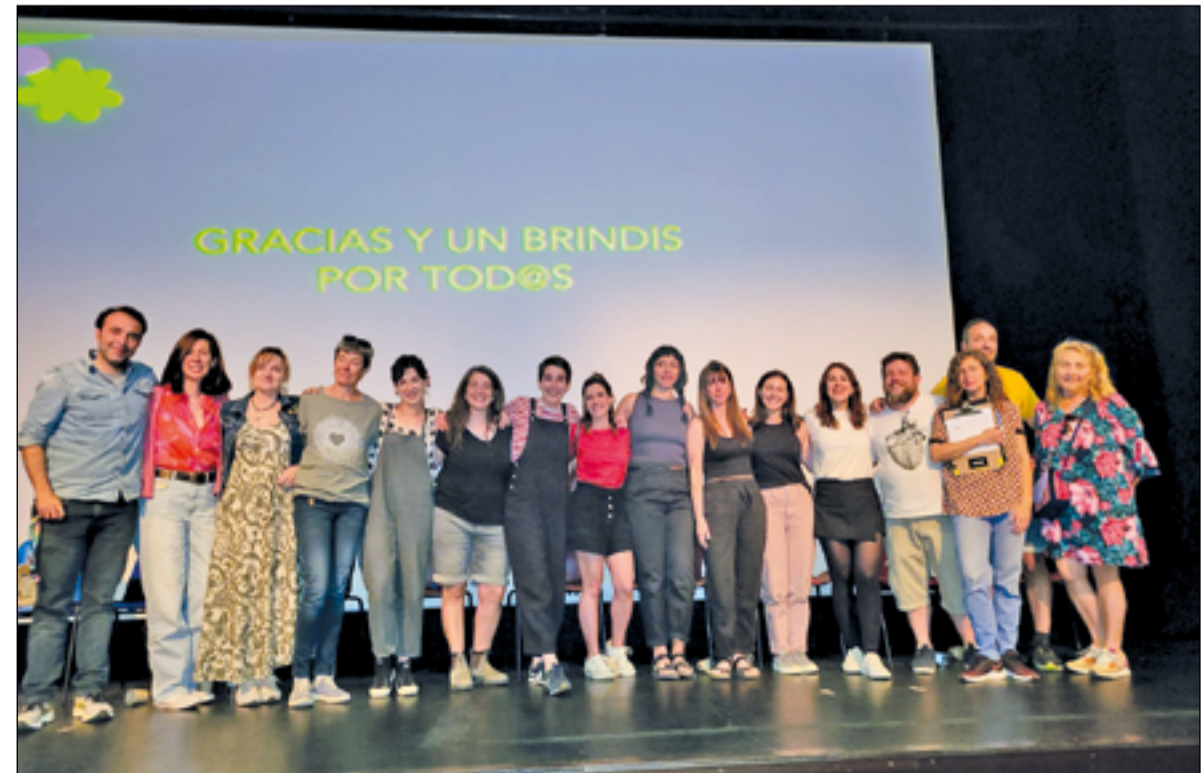
Organización, vignerona s y agentes del cine

Ha querido subrayar también que “Ferias enoturísticas como Now in Gredos sitúan a Chapinería en el mapa de ferias junto a ciudades como Barcelona, Roma, París, Mosela, Colonia o Innsbruck. Además, son experiencias respetuosas que cuidan de la naturaleza, de la cultura y de las personas”. Y añade “Seguiremos animando y apoyando actividades participativas desde nuestra concejalía tan beneficiosas, sea en lo cultural, como en lo social y lo turístico para el municipio y la comarca de la Sierra Oeste”.