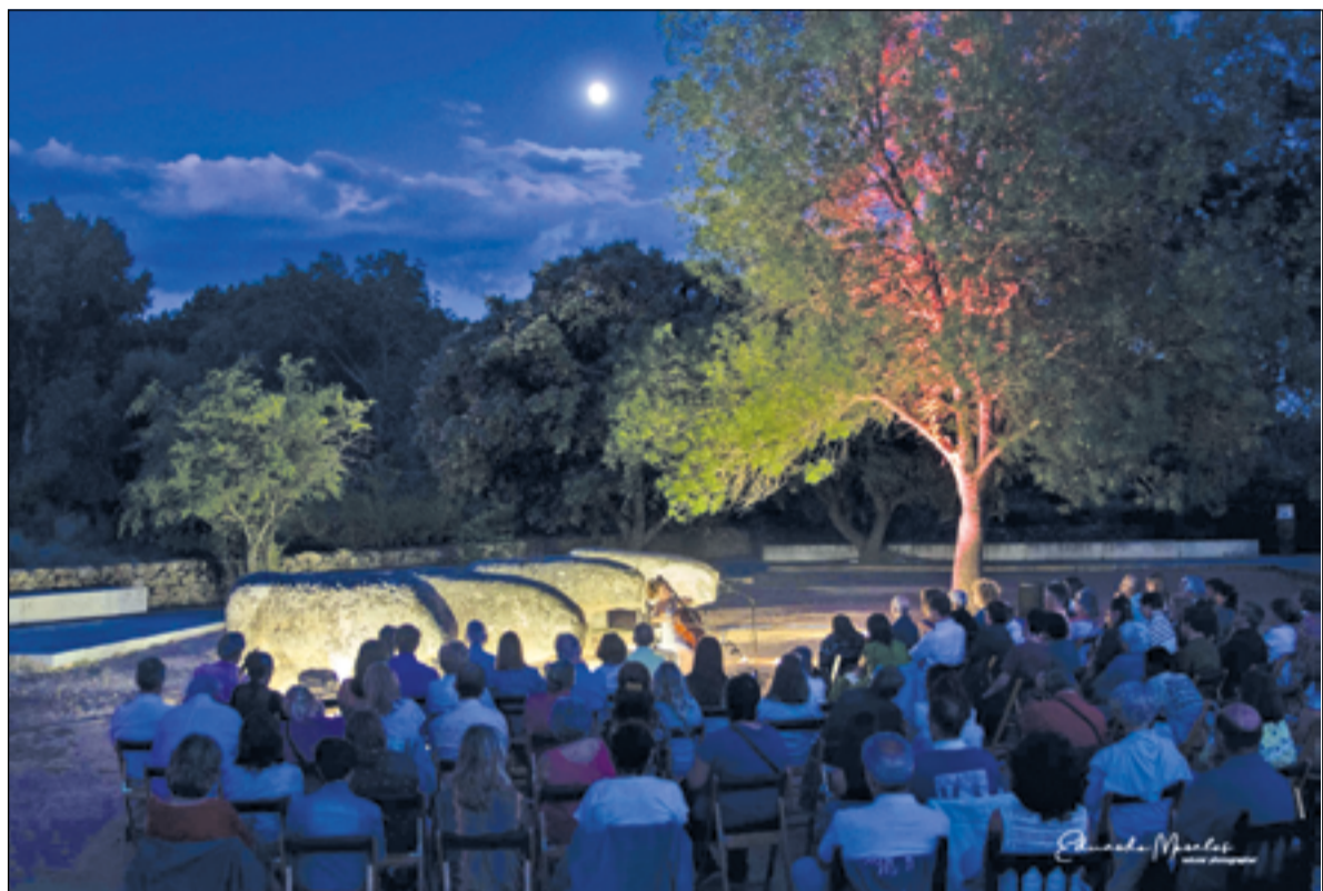
Concierto nocturno Música Y Piedras bajo las Estrellas 2023, en los Toros de Guisando.

En esa visita todos los presentes pudimos escuchar las últimas investigaciones arqueológicas e hipótesis sobre su significado, historia y ubicación. Los Toros de Guisando se encuentran en un enclave muy cercano a la ruta que los trashumantes han seguido desde tiempos inmemoriales y ahora se cree que pudo ser un monumento festivo que celebrase la primavera o el verano. De hecho, su orientación hacia el Cerro Guisando implica que cada 24 de junio los últimos rayos de sol que se ocultan tras