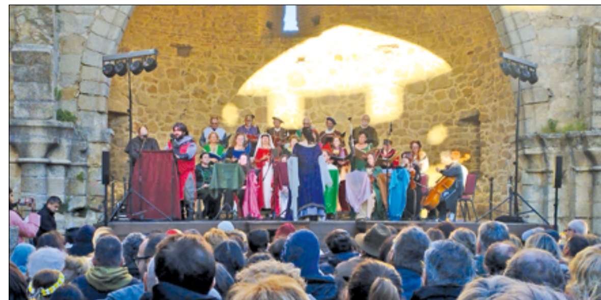
Concierto de Madrigales a cargo de la Camerata Cantabile, en el Castillo de La Adrada.

En esta vigésimo segunda edición, el Mercado Medieval recibió la visita de los Reyes Católicos, al igual que ocurrió en 1482, cuando los monarcas estuvieron en La Adrada o en 1495 cuando vinieron a ratificar la carta de villazgo concedida por Enrique II. En esta representación memorable, que fue muy del agrado del público y de las autori-