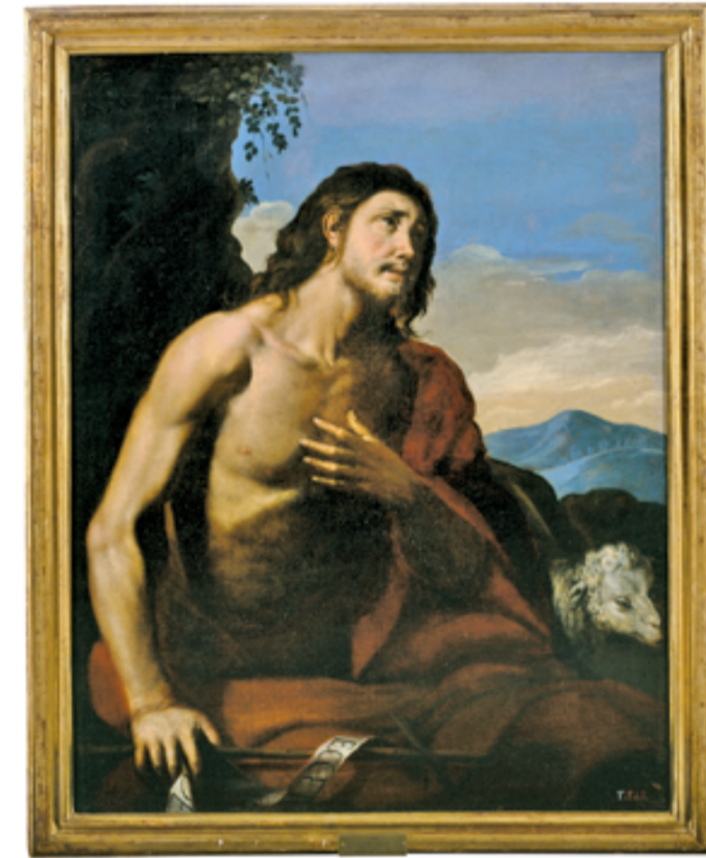
San Juan Bautista, de autor desconocido.

Este hallazgo desvela una nueva perspectiva sobre el Monasterio. No solo la arquitectura del mismo