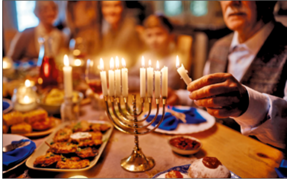
Celebración judía de la Janucá.