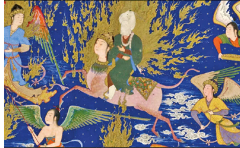
El Profeta Muhammad a lomos de Buraq.