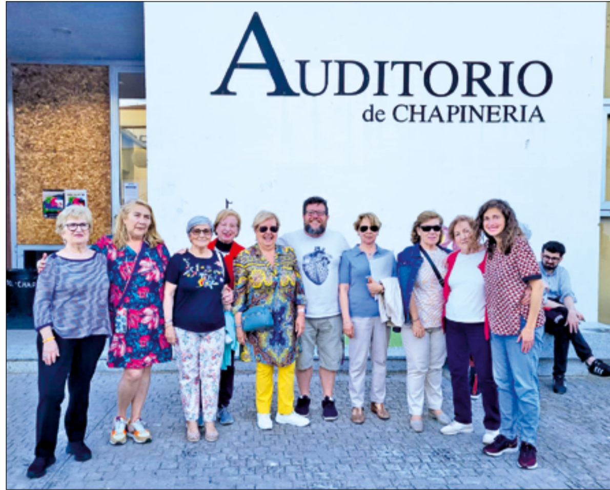
Mujeres de Chapinería junto a la organizadora.