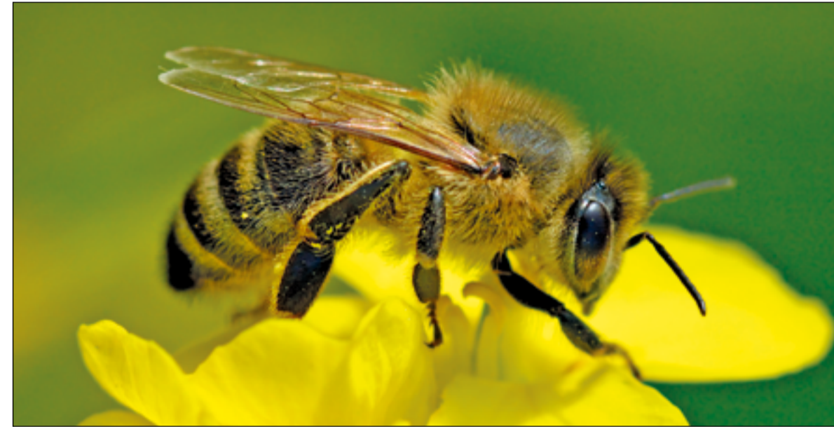
Abeja europea ( Apis mellifera ), también conocida como abeja doméstica o de la miel.

El hallazgo se producía durante las labores de mantenimiento de una de las antenas, momento en el que se detectaba la presencia de la colmena