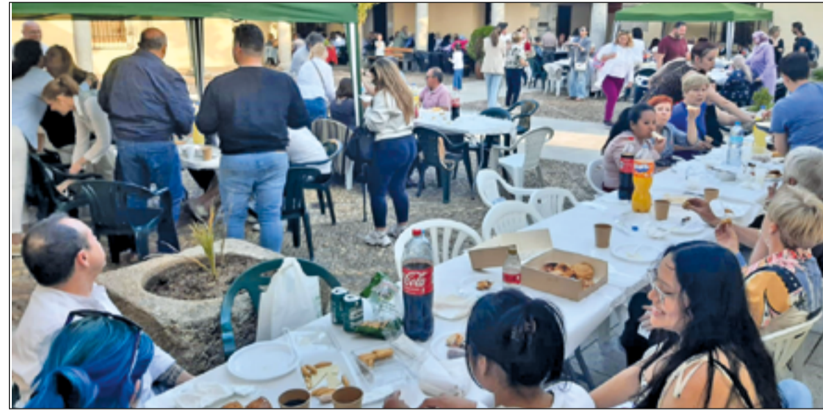
Alumnos durante la merienda.

En un marco inmejorable, en el patio del Palacio de la Sagra, y tras unas palabras de la directora del centro, que agradeció a los responsables municipales su colaboración para que la Educación sea un derecho permanente a lo largo de la vida, se procedió a la entrega de diplomas de los diferentes concursos que se