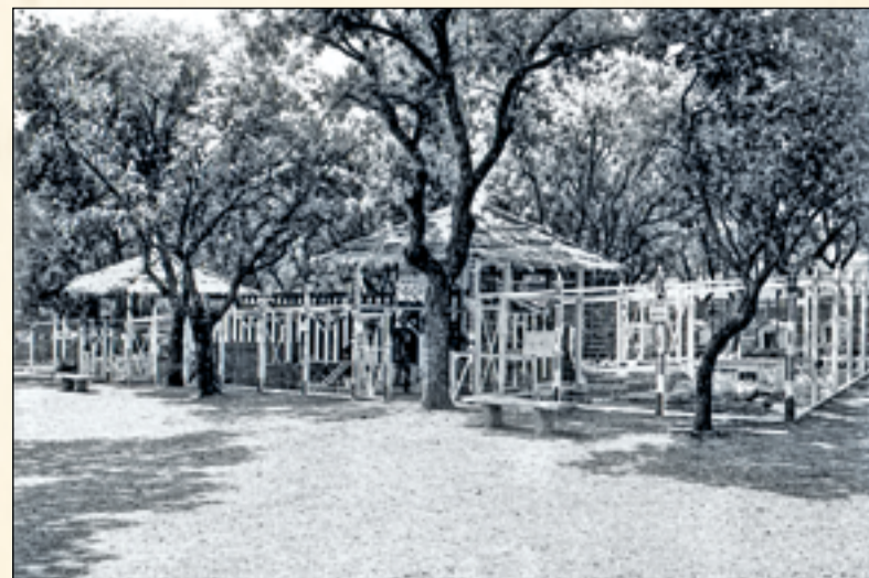
Vista de conjunto de la magnífica instalación de la Granja avícola La Jimena.

La instalación de la granja avícola “La Jimena”.— Entre las numerosas instalaciones avícolas que figuraban en el Concurso Nacional de Ganados, llamaba extraordinariamente la atención de la numerosísima concurrencia, la perteneciente a la Granja