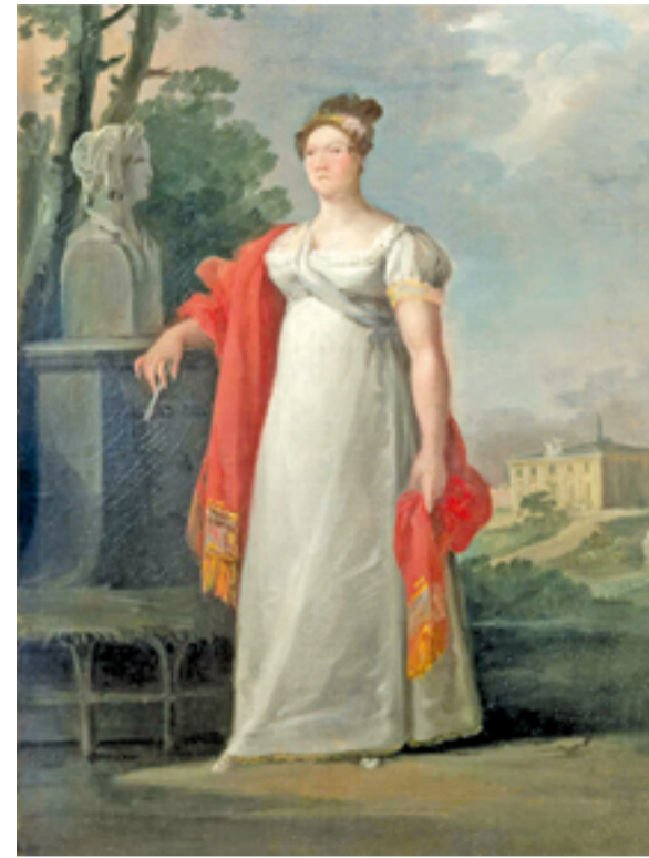
Dos reinas, Isabel de Farnesio (izquierda) y María Isabel de Braganza, fueron decisivas para que el Museo del Prado exista tal y como lo conocemos hoy.

año 2018. En el Premio Nacional de Artes Plásticas solo seis mujeres han sido premiadas a lo largo de 21 convocatorias.