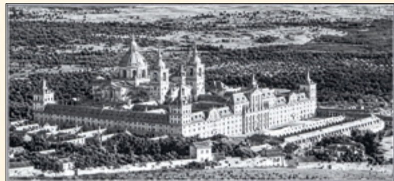
Vista del Real Monasterio de El Escorial.

Excursión a El Escorial.— Salida los lunes, miércoles y viernes, a las nueve y media de la mañana, regresando alrededor de las cinco y treinta minutos. El gigantesco Monasterio de El Escorial, situado a 50 kilómetros al NO. de Madrid, solo es inferior en tamaño y solidez a las Pirámides de Egipto, y es, al mismo tiempo, un Palacio, un Monasterio, una Iglesia y un Mausoleo. El Panteón de los Reyes es, seguramente, el más imponente monumento mortuario jamás erigido en la Tierra. En el viaje se emplea alrededor de una hora y media, y el camino es muy pintoresco. Precio de la excursión, incluyendo guía, gastos de entrada y propinas y almuerzo en el Hotel Reina Victoria, Ptas. 55. [La Revista de viajes, 4/1926]