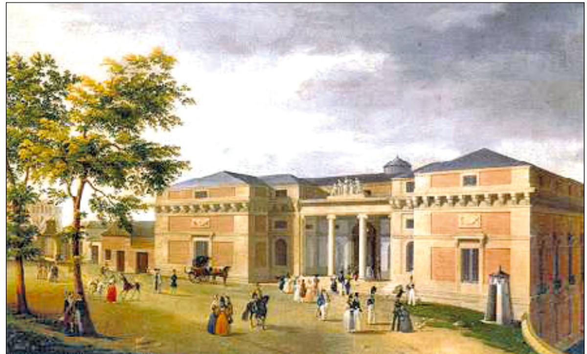
Entrada al Real Museo por el lado de San Jerónimo.

La llamada Guerra de Independencia paralizó las obras hasta que la llegada de Fernando VII y la reina María Isabel de Braganza lo convirtieron en lo que es hoy: la pinacoteca más importante del mundo con más de 8000 cuadros y 1100 esculturas. Hay dos murales que fueron definitivos para la culminación y transformación del museo: una, María Isabel de Braganza, que no pudo verlo terminado pues fue inaugurado un año después de su fallecimiento;