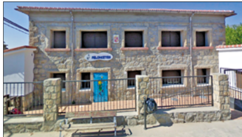
Escuela infantil de La Adrada.

Según explica el portavoz de Nuestra Tierra, Roberto Aparicio, distintos vecinos y trabajadores municipales han trasladado su inquietud por las decisiones adoptadas en los últimos meses en relación con la gestión de servicios públicos. Entre ellas, la privatización del velatorio municipal y ahora la externalización