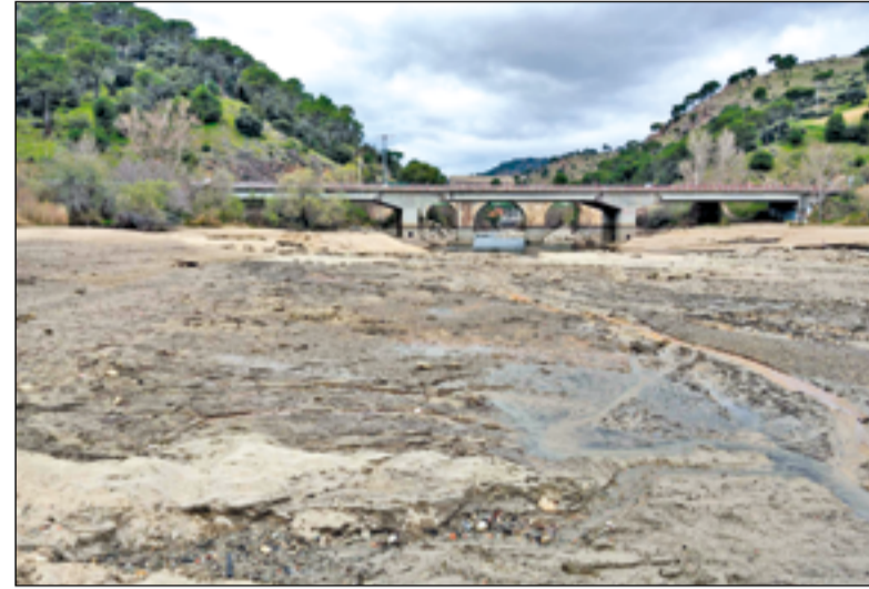
Las compuertas del embalse de Picadas llevan su capacidad al 60% y la cola del embalse ofrece esta inusual estampa, sobre todo teniendo en cuenta las abundantes lluvias de este invierno.