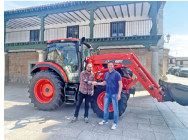
El 24 de abril el Ayuntamiento de Villa del Prado recibió, por parte de Agrícola del Prado, un tractor con pala Kiota XS 1201. Este vehículo se ha adquirido gracias a una subvención de la Dirección General de Agricultura de la Comunidad de Madrid y estará destinado a la reparación de caminos y la limpieza de cunetas junto con el desbrozador lateral que el Ayuntamiento adquirió hace unas semanas. El Ayuntamiento únicamente ha asumido el coste correspondiente al IVA.