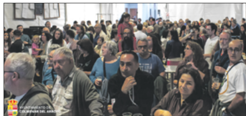
Interior de la carpa instalada por el Ayuntamiento.

Además de la degustación de pinchos y cazuelitas, la programación incluyó actividades complementarias que enriquecieron la experiencia. El Mercado de Productores Locales permitió conocer y adquirir productos artesanales de la zona, mientras que las catas de vino, quesos y miel acercaron al público a los sabores