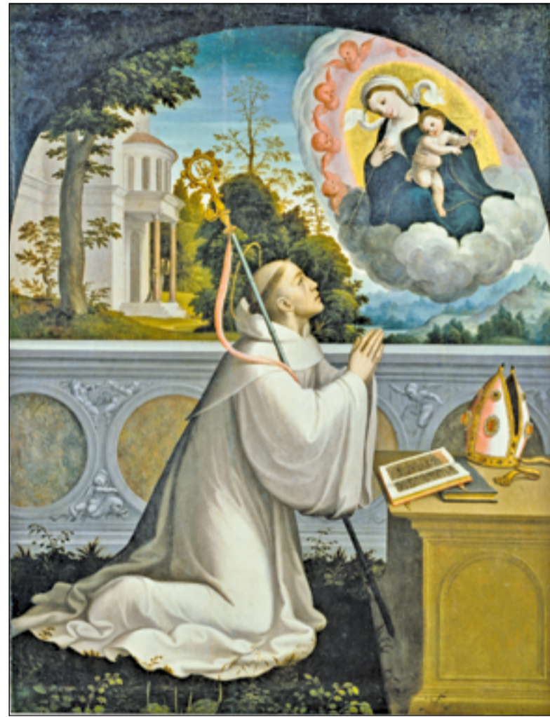
Aparición de la Virgen a San Bernardo . 1540 - 1545. Óleo sobre tabla, 170 x 130 cm. Museo Nacional del Prado