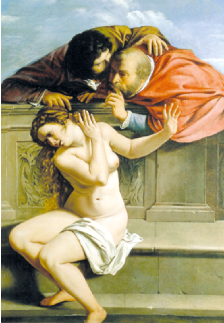
Susana y los viejos, de Artemisia Gentileschi (Castillo Weissenstein).

Lo más interesante para nuestro estudio es que, como ya ocurriera con el Siglo de Oro del barroco, las mujeres van a protagonizar una revolución silenciosa que las va a llevar a disputar a los varones la exclusividad del ejercicio del poder. Va a ser una revolución silenciosa que arranca de las artes y las letras, una revolución representada por el trabajo de numerosas artistas que pagarán con su sangre la libertad de poder elegir su destino. Una de esas mujeres se llama Artemisia Gentileschi. Su historia es la de tantas mujeres que vieron sacrificado su vida y su honor para defender sus derechos. Artemisia era hija de un pintor toscano llamado Orazio, que había detectado los valores innatos de su hija y la había puesto como aprendiz en el taller de su amigo Agostino Tassi, el cual,