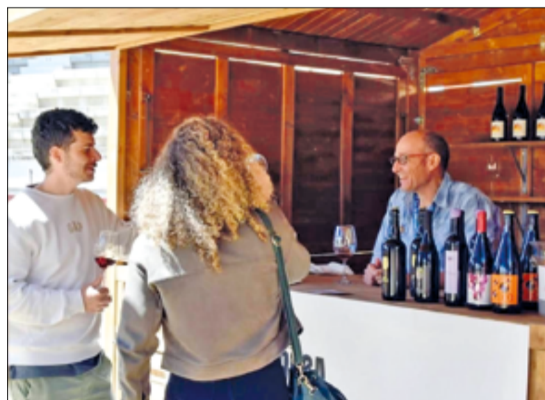
Mostrador de la Bodega Siguín, de Cadalso de los Vidrios.