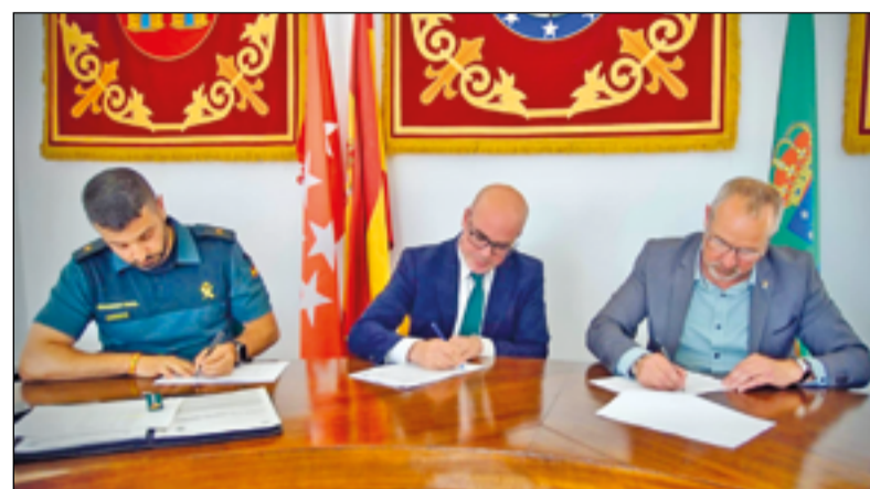
Guardia Civil, delegado del Gobierno y alcalde durante la firma.

Asimismo, ha querido reconocer el compromiso que manifiesta en su lucha contra la violencia de género, que supone la adhesión al Protocolo