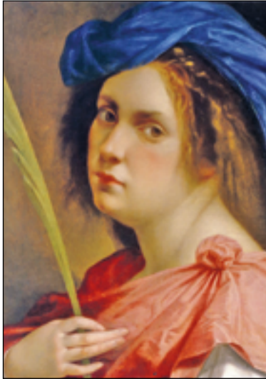
Autorretrato, Artemisia Gentileschi.

La llegada a España de los borbones ilustrados pondrá al pueblo al borde de las nuevas corrientes no solo de lo que en su día fue un inmenso imperio, en los siglos XVI y XVII, sino que el viejo imperio de los Austrias verá cómo el declive de su poder se irá haciendo ostensible durante el XVIII y el XIX. Una de las constantes de la evolución del viejo imperio consiste en que a los años marcados por el declive del poder político y militar en Europa seguirán otros de incansable lucha por el acercamiento a las corrientes europeas, con los ojos puestos en las nuevas tendencias. Destacan, por una parte, lo que podríamos llamar el final de una época en la que los Tercios habían llevado el poder del imperio a todos los lugares de Europa y, por otra, la presencia de