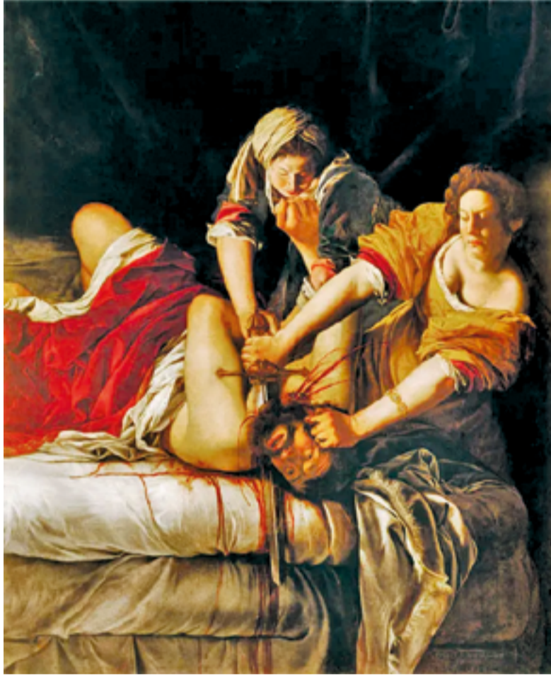
Judit decapitando a Holofernes, de Artemisia Gentileschi (Galería Uffizi).

Hoy, Artemisia es un símbolo de la lucha femenina por la libertad y la dignidad, una figura que crece en relevancia dentro de la historia del arte